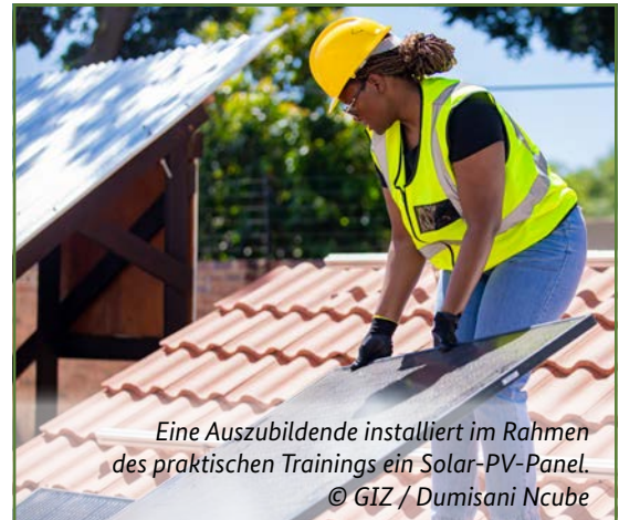
Eine Auszubildende installiert im Rahmen des praktischen Trainings ein Solar-PV-Panel.

Die südafrikanische JETP setzt beim Ausbau der erneuerbaren Energien stark auf den Privatsektor. Damit dies gelingt, hat Südafrika seine Gesetze angepasst und die notwendigen Rahmenbedingungen verbessert. Dies hat bereits zu einem deutlichen Anstieg privater Investitionen in erneuerbare Energien geführt.